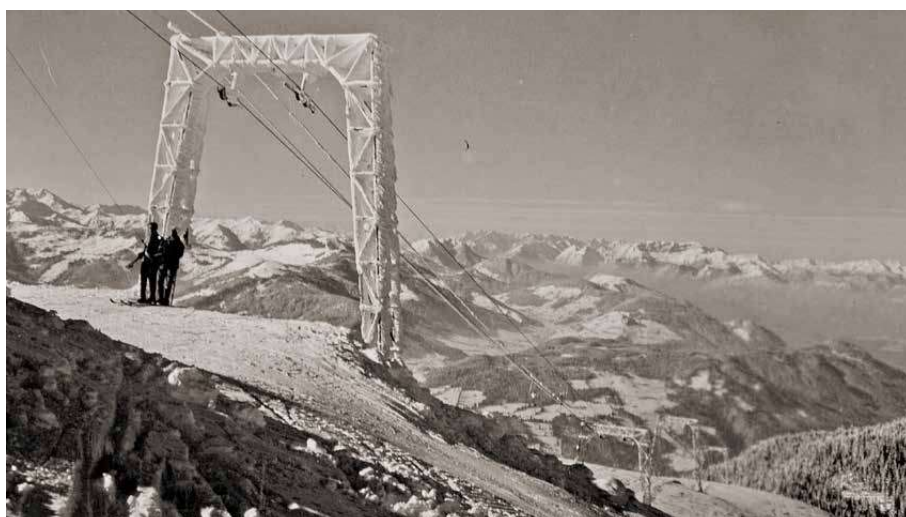
Der Gipfelschlepplift auf die Hohe Salve in den Kitzbüheler Alpen.